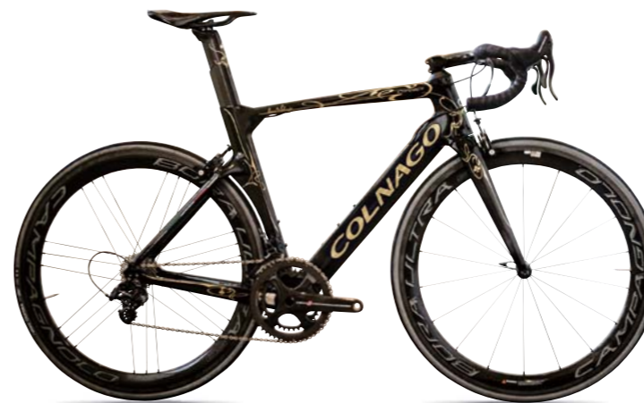
NJDK (ブラック/ゴールド)