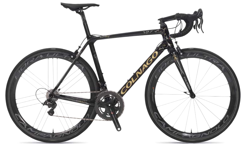
VJDK (ブラック/ゴールド)