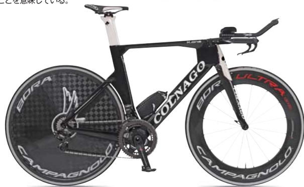
KOWH (ブラック/ホワイト)