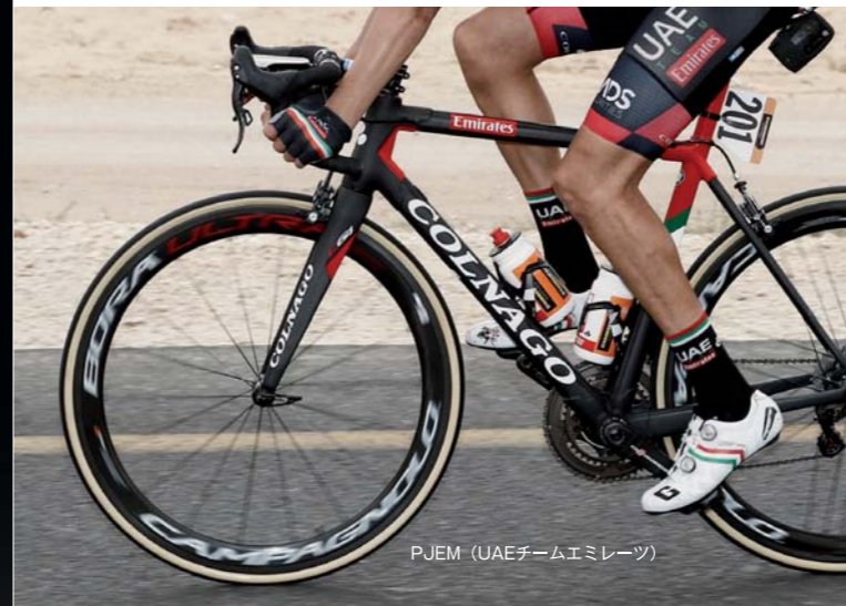
PJEM (UAEチームエミレーツ)