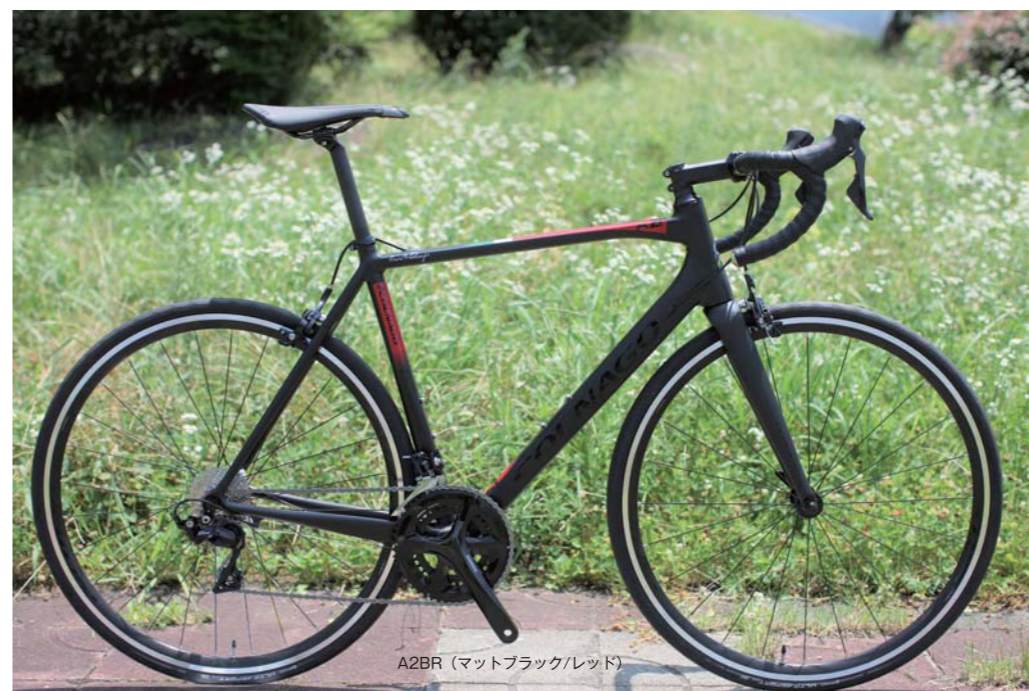
A2BR (マットブラック/レッド)