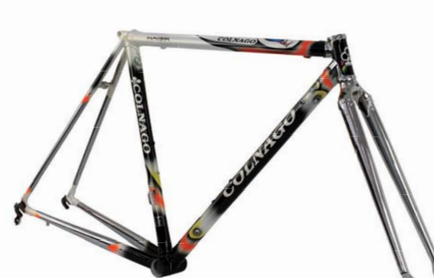
LX4 (ホワイト/ブラック)