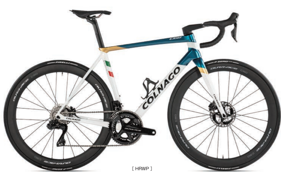
[ HRWP ]