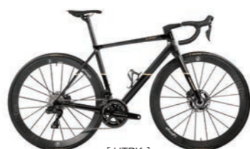
[ HTBK ]

PRICE : フレームセット Disc 仕様 ¥913,000 (税込) (HRRP、HRRD、HRWH、HRBK) フレームセット Disc Titanium 仕様 ¥1,100,000 (税込) (HTBK) COLOR : HRWP [ホワイト]、HRRD [ブラックレッド]、HRWH [ブラックホワイト]、HRBK [ブラック]、HTBK [ブラックゴールド] (世界限定 250台) Frame size : 420S / 455S / 485S / 510S / 530S / 550S / 570S *完成車については、公式サイトでのプレミアムパッケージをご覧ください。