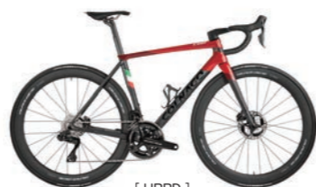
[ HRRD ]