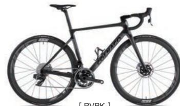
[ RVBK ]