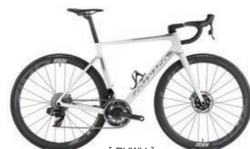
[ RVWH ]

PRICE : フレームセット Disc 仕様 ¥891,000 (税込) COLOR : SDM3 [UAE Team エミレーツ]、WT23 [Team ADQ]、RVBK、RVRD、RVWH Frame size : 420 / 455 / 485 / 510 / 530 / 550 / 570 *完成車については、公式サイトでのプレミアムパッケージをご覧ください。