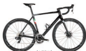
[ HRBK ]