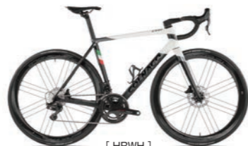
[ HRWH ]