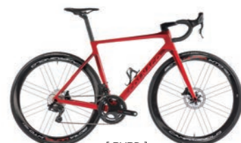
[ RVRD ]